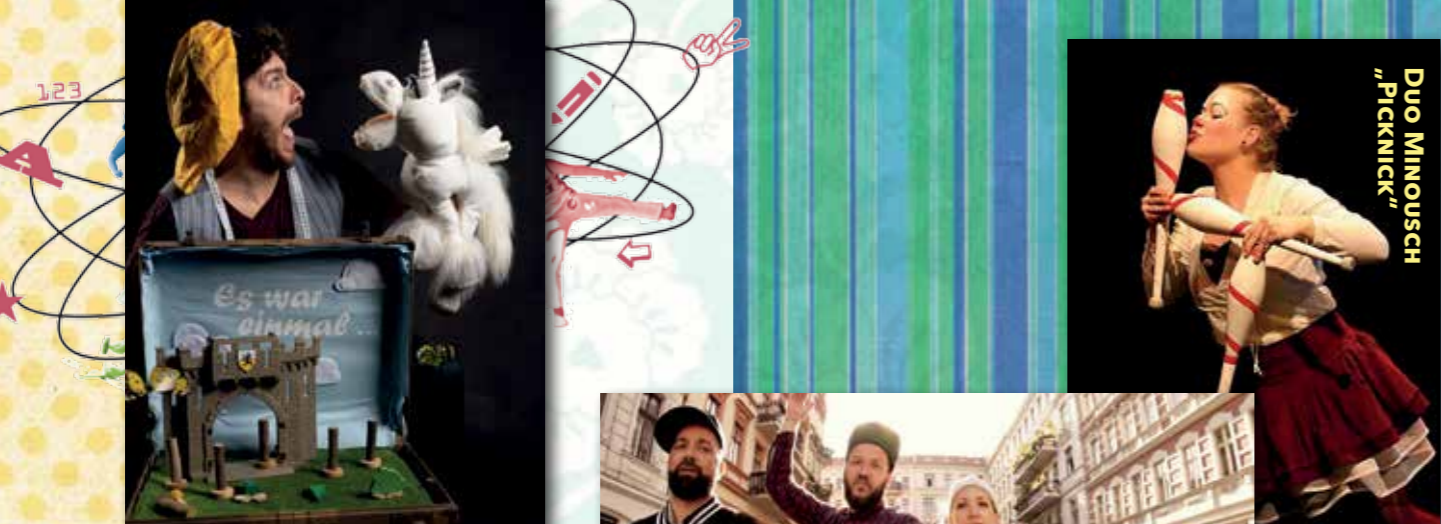
McKENNA'S THEATER „DAS TAPFERE SCHNEIDERLEIN“