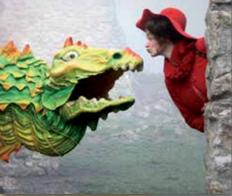
THEATER ONIVERSUM „ONIL DER DRACHE“